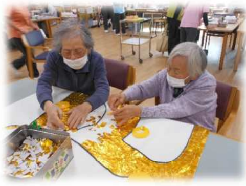
久しぶりの大作！来年の干支を作っているニョロよ！