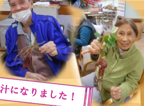
収穫したサツマイモは、お汁になりました！